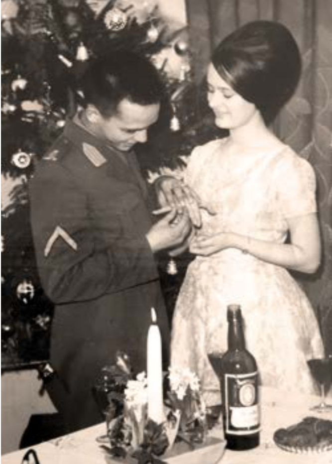
Verloofd in 1964 in Oisterwijk.

Op mijn elfde jaar deed ik communie en mijn latere vrouw ook. 'Wat een mooi meisje!', dacht ik. Vijf jaar later ontmoette ik haar in de regen op de kermis. Ik sloeg een arm om haar heen en liet haar nooit meer los. Zodra ik kon ging ik bij mijn schoonouders wonen. In 1962 ging ik als gemeenteambtenaar werken en eind 1964 trouwden we. Ik werd beleidsmedewerker bij het ministerie van Onderwijs, de Provincie Zuid-Holland en bij de gemeenten Berkel en Rodenrijs en Capelle aan den IJssel. Eenmaal met pensioen wilde ik me graag blijven inzetten voor het verbeteren van de positie van Indische oorlogsgetroffenen en werd cliëntenraadslid bij de Pensioen- en Uitkeringsraad.'