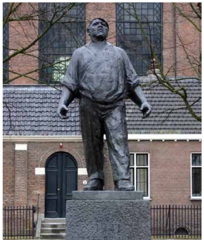
De staking wordt jaarlijks op 25 februari herdacht bij het standbeeld "De Dokwerker" van beeldhouwer Mari Andriessen op het Jonas Daniël Meijerplein in Amsterdam. De herdenking staat in het teken van de blijvende strijd tegen fascisme en racisme.