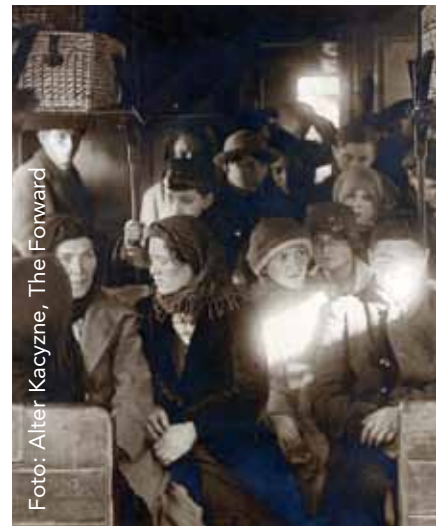
Jewish Immigrants on Train.

Alle informatie is vanaf oktober te vinden op de site www.joodsfilmfestival.nl en www.jhm.nl