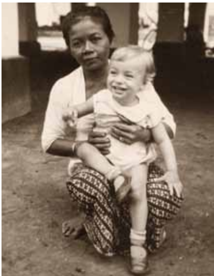
Onze baboe paste op mij, Balikpapan 1940.