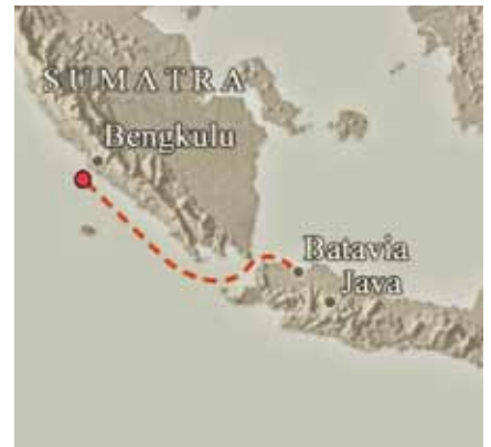
Route van de Junyo Maru en ondergang (zie rode stip).

Een Japanse reddingsboot keerde weer terug na de Japanse overlevenden aan land te hebben gezet. De korvet kwam recht op ons