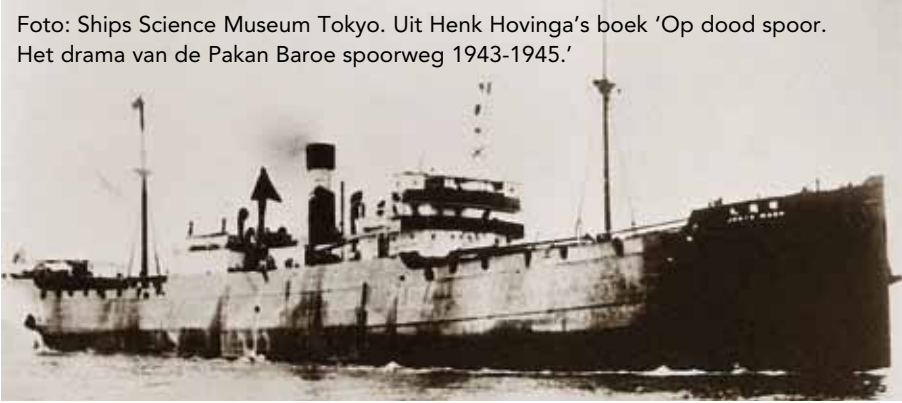
Het Japanse vrachtschip de Junyo Maru.

Uit Henk Hovinga's boek 'Op dood spoor. Het drama van de Pakan Baroe spoorweg 1943-1945.'